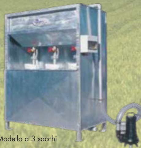
Modello a 3 sacchi