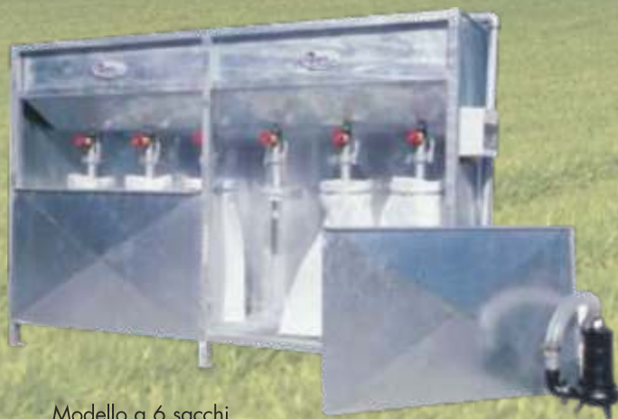
Modello a 6 sacchi