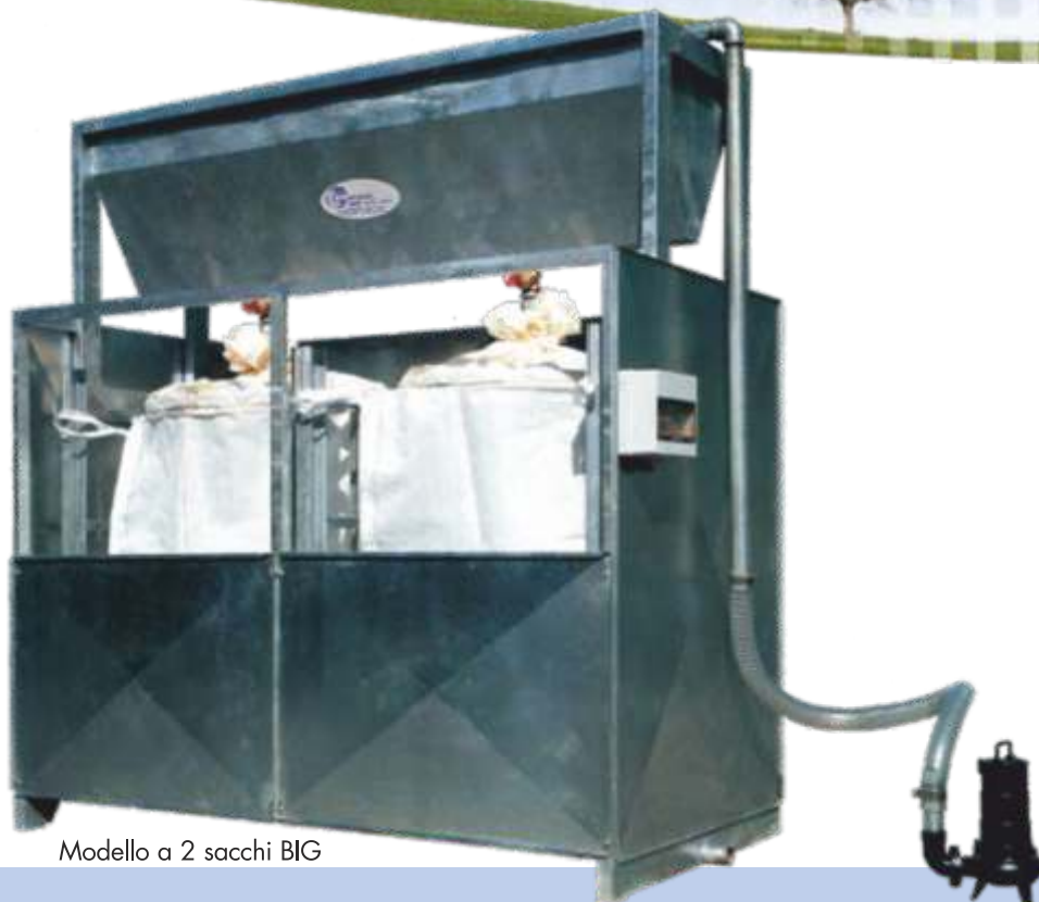
Modello a 2 sacchi BIG

L'impianto è rispondente alle vigenti normative in materia di impatto ambientale e sicurezza sul lavoro.