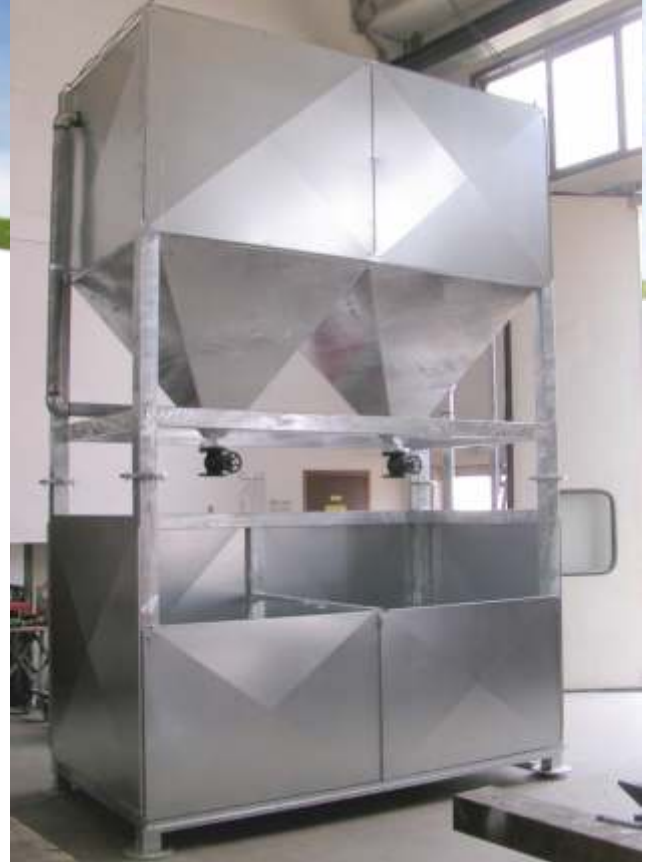
Capacità 6000 lt e n°2 sacchi BIG