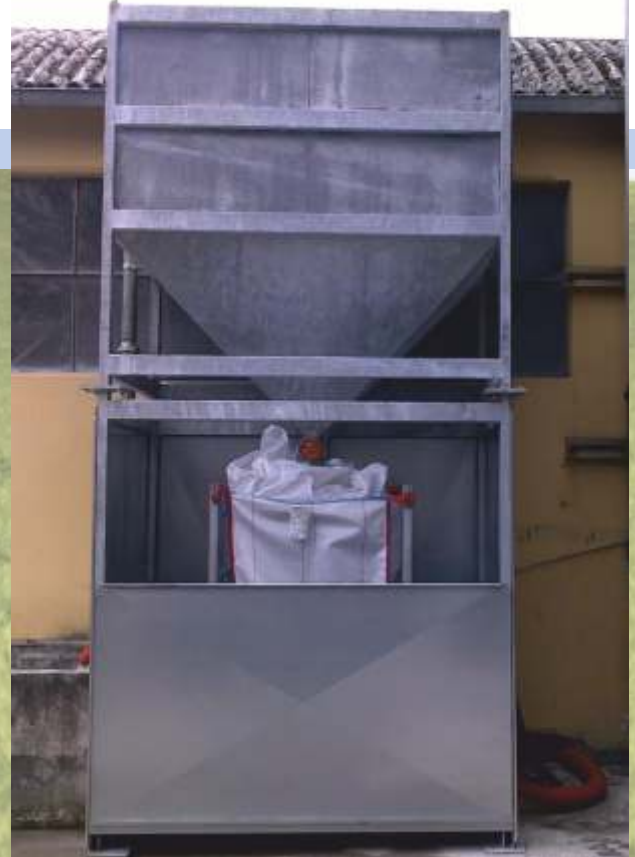
Capacità 3500 lt e n°1 sacco BIG